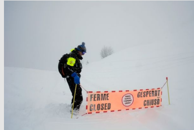
Pisteur secouriste en haute montagne