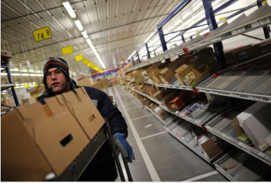
© Guillaume J. Plisson / INRS Travail en entrepôt frigorifique