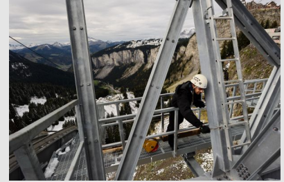
Travail en altitude (Ici chantier de construction d'un téléphérique en montagne)