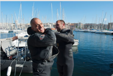
Plongeurs professionnels se préparant à intervenir