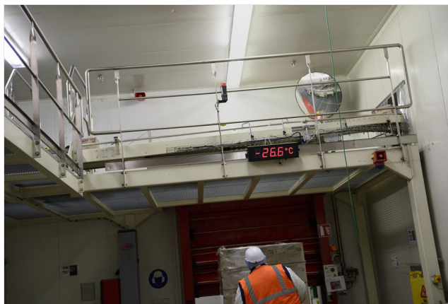
Affichage de la température ambiante dans une chambre froide

Pour les travaux à l'intérieur de locaux, en installations frigorifiques par exemple, il convient de relever les températures à l'intérieur des installations. Celles-ci doivent être équipées d'instruments de suivi. Pour les travaux en extérieur, il est nécessaire de surveiller régulièrement les fluctuations de température.