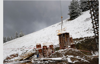
Chantier de BTP en hiver