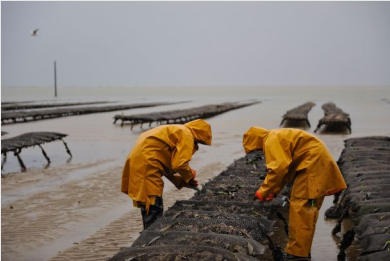
Ostréiculteurs travaillant sous les intempéries