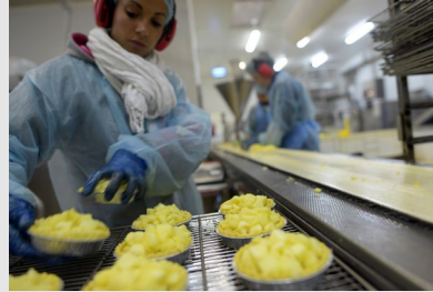
Chaîne de fabrication réfrigérée dans l'industrie agroalimentaire